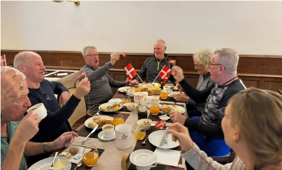
Finns fødselsdag fejres