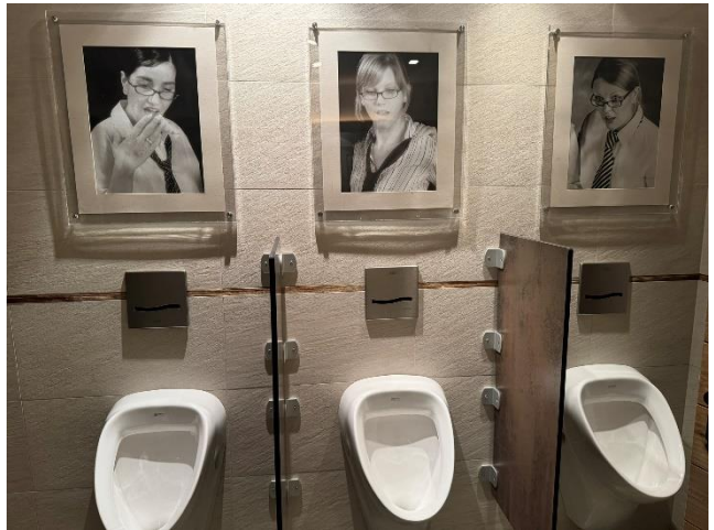
Nogle steder er der en ko der kigger.....og nogle steder er det andre...