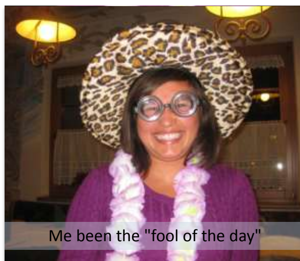
Me been the "fool of the day"