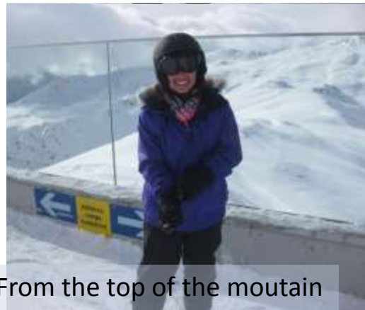
From the top of the moutain

I was a little sad when the ski holyday finished because in that place I discover new things of myself, always it's hard to leave a place that teach you so many things about you that you never knew about yourself .