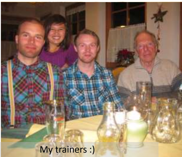
My trainers :)