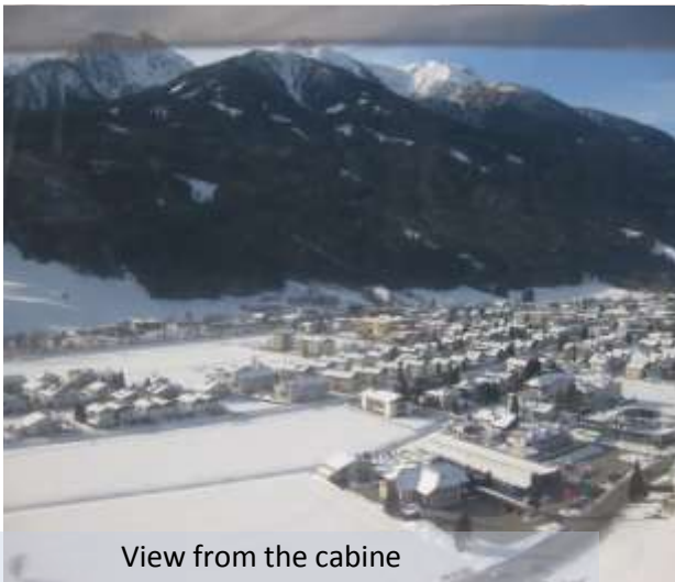
View from the cabine

Every day I take 1 hour of ski lessons, after that I was free. In my free time I usually read a book, but when the skiing zone was free I skiing and practice the things that I have learned. As the days passed I spend more time skiing than reading. And the last days I could ski with my host family and friends.